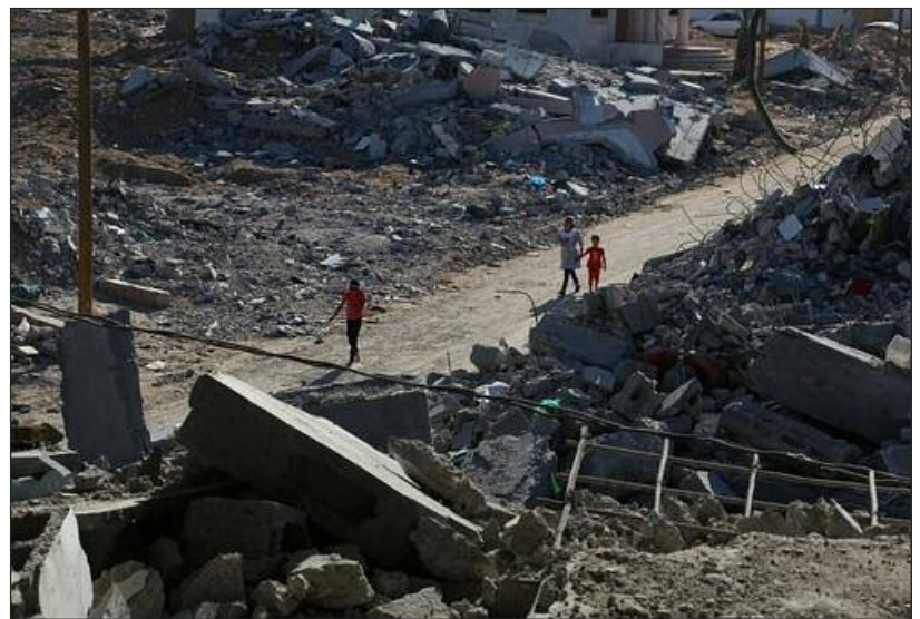
Un conflit qui a déjà fait de nombreuses victimes (photo libre de droits)